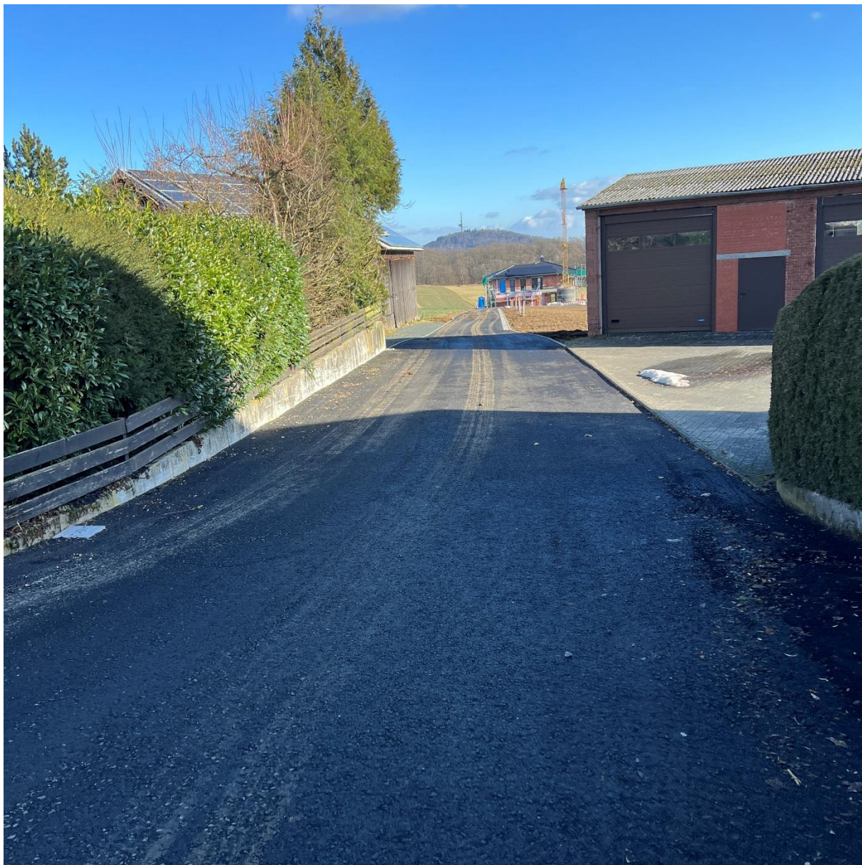
Foto 1 Blick in Richtung Osten, Standort: Steinstraße

Im Einmündungsbereich ist die Straße auf etwa 6 m und im östlichen Bereich auf etwa 4,2 m asphaltiert.