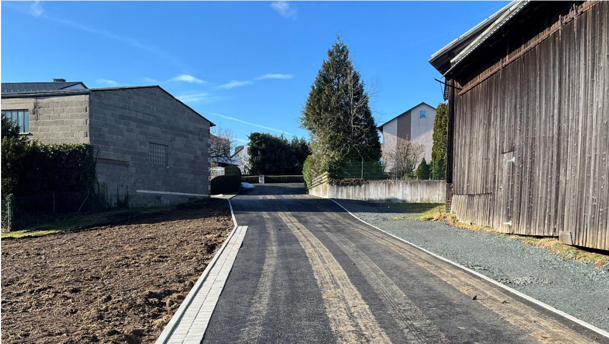
Foto 2 Blick in Richtung Westen, Standort: östliches Ende der neuen Erschließungsstraße

Die dreiecksförmige Fläche, die im Bebauungsplan ebenfalls als Straßenfläche festgesetzt ist und südlich der eigentlichen Straßenparzelle liegt, ist noch nicht befestigt, siehe Abbildung (grüner Pfeil) und Foto 2.